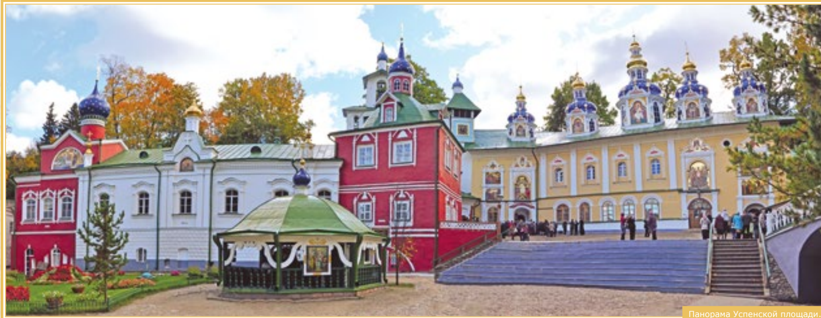
Панорама Успенской площади.

в состоянии вместить всех верующих, и богослужения совершаются под открытым небом – на паперти Михайловского собора и на Успенской площади, где иконостасом становятся фасады Успенского собора и Покровской церкви.