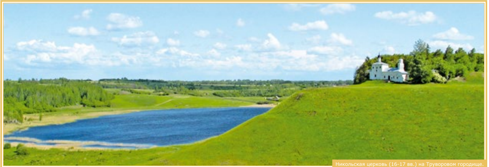
Никольская церковь (16-17 вв.) на Труворовом городище.

И покидая эти изумрудные берега, вы – мысленно – никогда не уйдёте отсюда: ваш незримый двойник, всё лучшее и доброе, что в вас есть, останется здесь и, словно безгрешный ребёнок, будет восхищённо смотреть в бездонную синеву изборского неба.