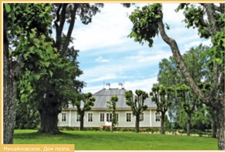
Михайловское. Дом поэта.