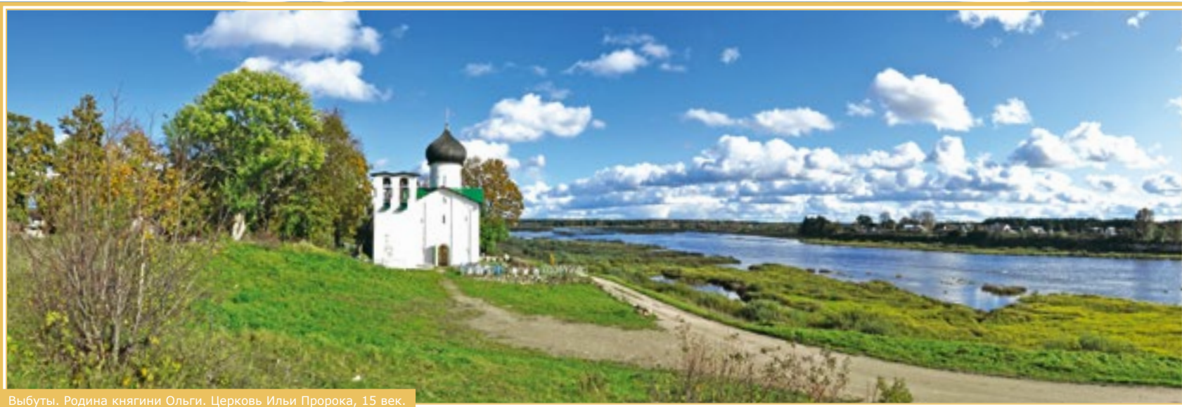
Выбуты. Родина княгини Ольги. Церковь Ильи Пророка, 15 век.

Вот она – на первый взгляд обычная, «кончанская» церковь Николы со Усохи. Вот они, незатейливые украшения – фирменный почерк псковской школы: поребрик, бегунец, утопленный декор. Грубый