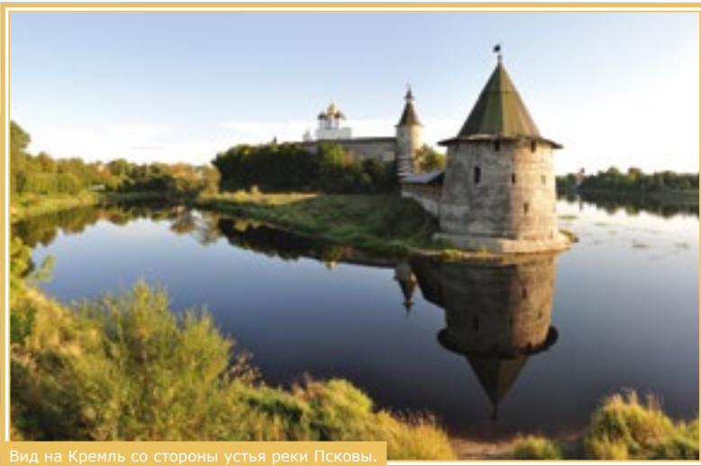
Вид на Кремль со стороны устья реки Псковы.