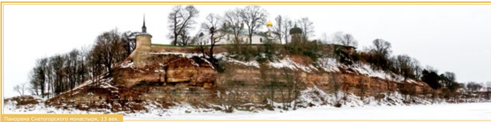
Панорама Снетогорского монастыря, 13 век.

А живописную панораму самого монастыря лучше всего обозревать с другого берега реки или с палубы прогулочного парохода. Как знаменитый дворец «Ласточкино гнездо» в Крыму, строения Снетогорской обители каким-то чудом вот уже несколько столетий держатся на отвесной скале. И, быть может, недалёк тот радостный день, когда прекрасный силуэт монастыря вновь украсит устремлённая ввысь белокаменная свеча восстановленной церкви Вознесения под Колоколы. Сие да свершится!..