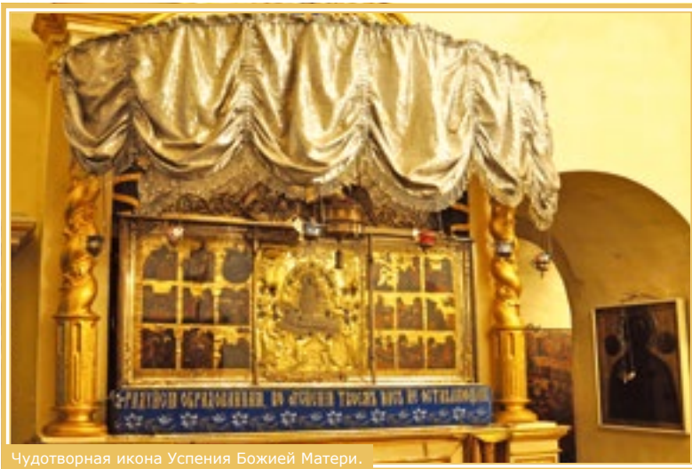
Чудотворная икона Успения Божией Матери.