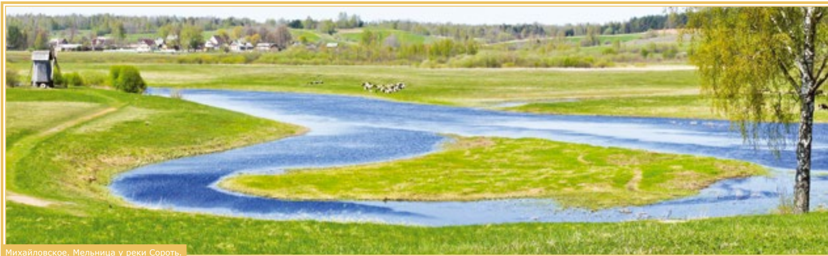
Михайловское. Мельница у реки Сороть.