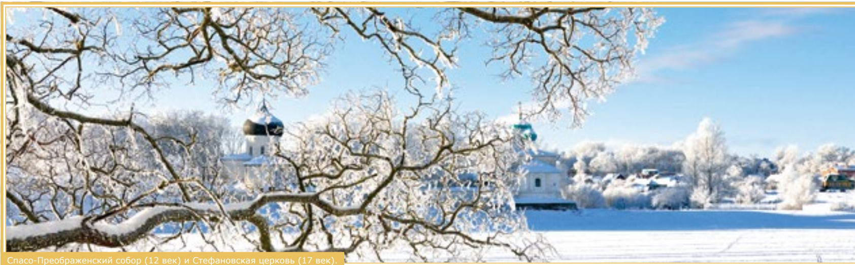
Спасо-Преображенский собор (12 век) и Стефановская церковь (17 век).