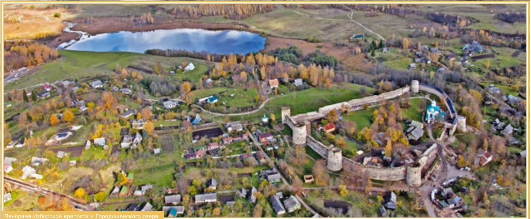
Панорама Изборской крепости и Городищенского озера.