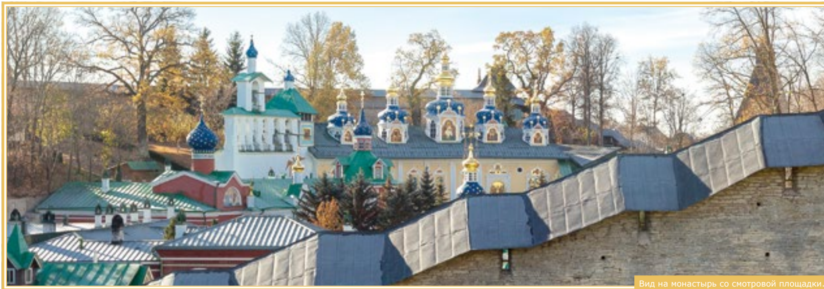
Вид на монастырь со смотровой площадки.

Свято-Успенский Печерский монастырь меняет к лучшему жизнь каждого человека, ступившего однажды на эту священную землю. Каждый, побывавший здесь, уносит в своём сердце незримые частицы благодати, которые непременно принесут дивные плоды.