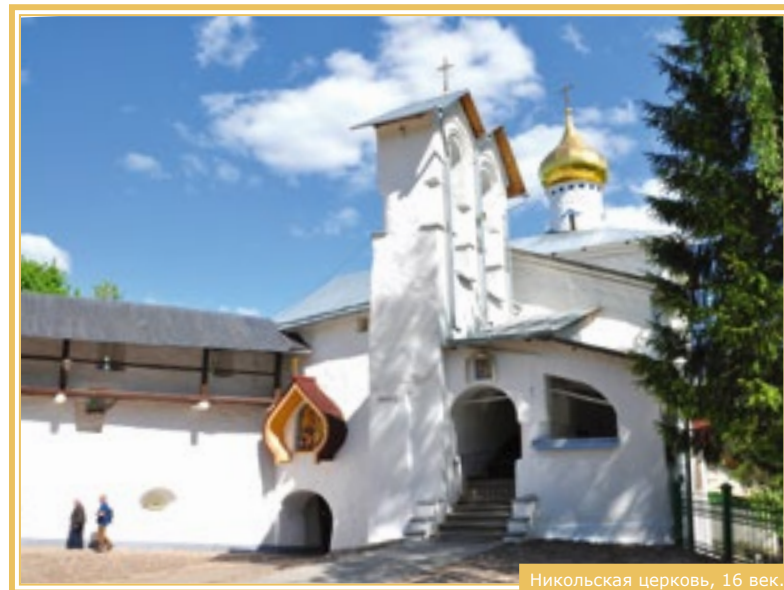
Никольская церковь, 16 век.

Ещё один замечательный храм, построенный при игумене Корнилии, Никольская надвратная церковь, освящённая в 1565 году. Внутри храма можно увидеть великое множество редких, поистине бесценных, икон, среди которых образ Богоматери – небесной игуменьи Печерской обители, и чудотворный образ самого Николы Ратного – одна из самых необычных на Руси икон 16 века с выпуклым резным изображением Николая Чудотворца. В конце 20 века в