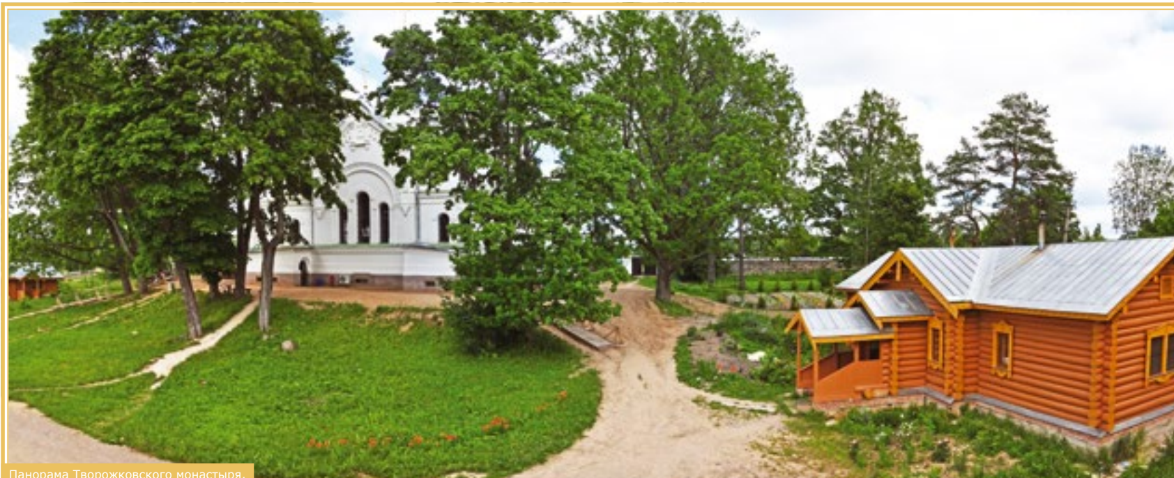
Панорама Творожковского монастыря.