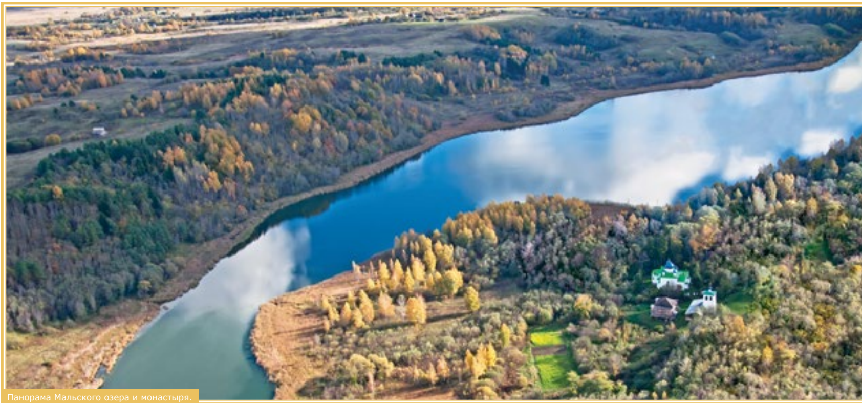
Панорама Мальского озера и монастыря.

Примерно в 4 километрах от Изборска, на самом дне Мальской долины, сокрыта от любопытных глаз и мирской суеты драгоценная жемчужина – Мальской монастырь, основанный пустынножителем Онуфрием в конце 15 века. В настоящее время здесь устроен скит Свято-Успенского Псково-Печерского монастыря.