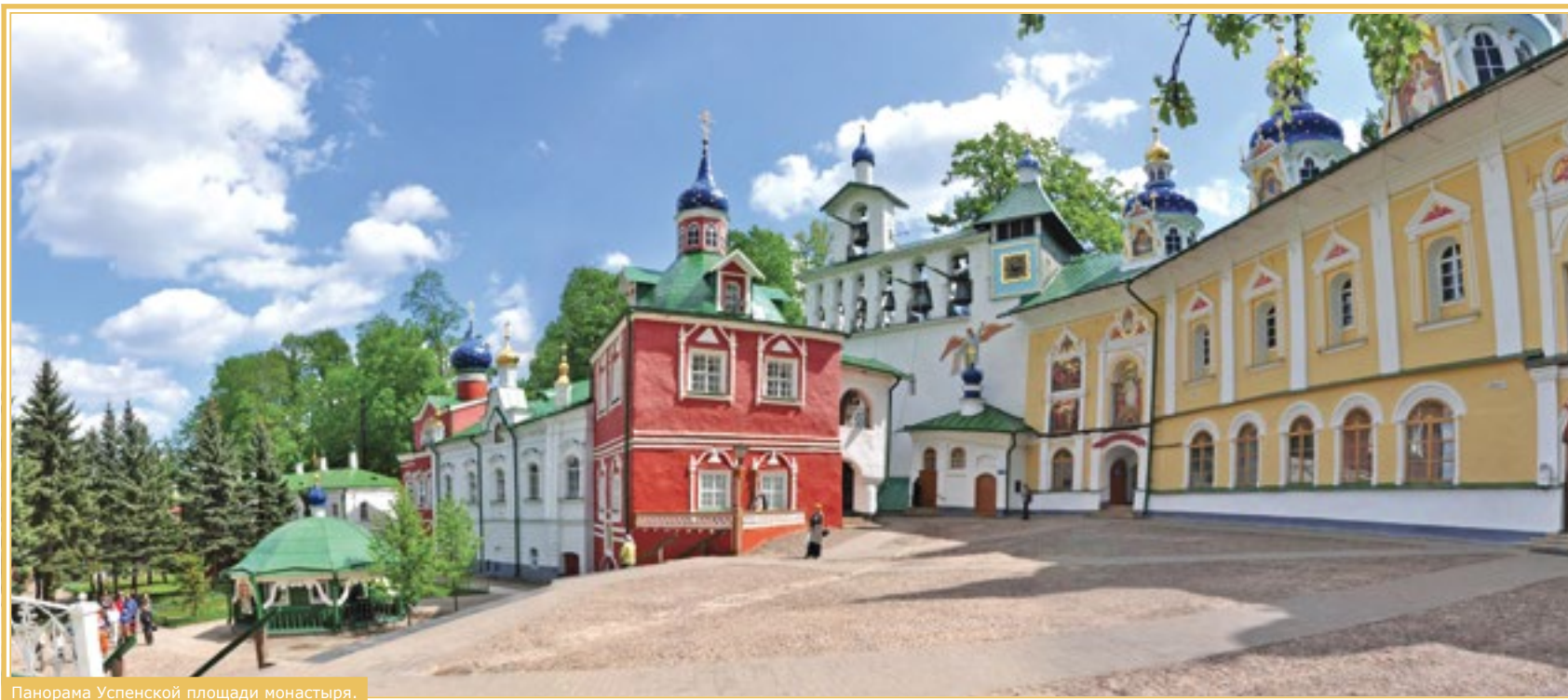
Панорама Успенской площади монастыря.

Свято-Успенский Псково-Печерский монастырь меняет к лучшему жизнь каждого человека, ступившего однажды на эту священную землю. Каждый, побывавший здесь, уносит в своём сердце незримые частицы благодати, которые непременно принесут дивные плоды.