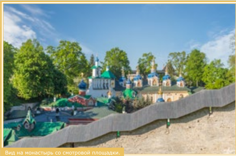
Вид на монастырь со смотровой площадки.