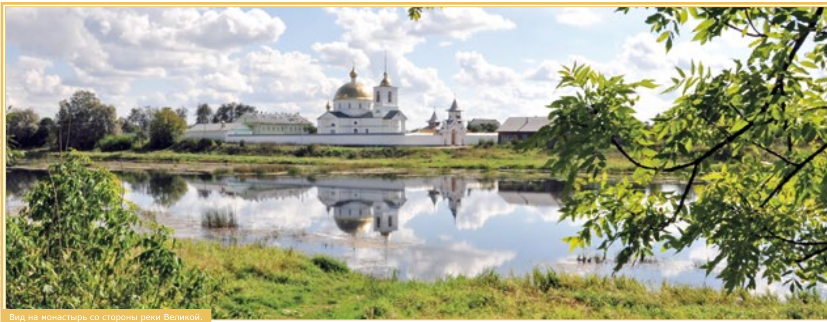
Вид на монастырь со стороны реки Великой.

50 км от Пскова – и вы в славном городе Острове, где находится Спасо-Казанский Симанский монастырь. Город полностью оправдывает своё название: это, действительно, остров между двух рукавов реки Великой. Уже в 1341 году, по свидетельству летописных источников, Остров стал каменной крепостью. К сожалению, несмотря на мощные укрепления и мужество защитников крепости, силы иноземных врагов почти всегда были намного больше. И в средние века Остров неоднократно захватывался и выжигался дотла немцами, поляками и литовцами. Крепостные стены до наших дней не сохрани-